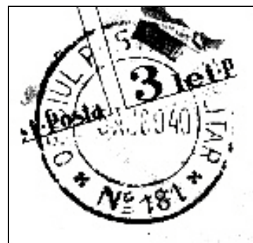
5.8.1940: Ștampila OPM 181, a Brigăzii 2 Mixte Munte.

Este trimisă din nou pe front în 13.7.1942 (Caucaz, Kuban, Crimeea). Revine în țară în mai 1944, fiind dislocată, până la 23.8.1944 în garnizoanele din zona Hațeg - Deva - Simeria - Aiud (subordonată Corpului de Munte).