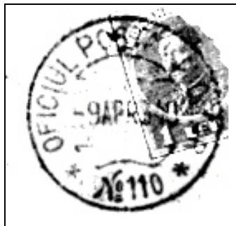
9.4.1940: Ștampila OPM 110, prima folosită de Brigada 3 Munte.

după 10.5.1944, în subordinea Corpului 7 Teritorial, aici găsimu-se și la 23.8.1944.