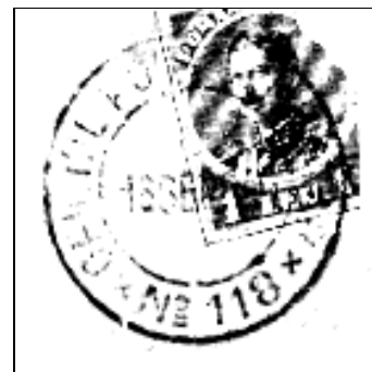
18.9.1940: Ștampila OPM 118, a Brigăzii 1 Fortificații, la câteva zile după retragerea din Ardealul de Nord..

Se înființează (la 27.6.1939 ?) în Oradea, prin formarea Reg.2 Fort. din Reg. 86 Infanterie (Reg. 1 Fortificații exista din 1938). De la data formării și până la data cedării Ardealului (între iulie 1939 - august 1940) a fost desfășurată pe frontieră, în linia I, în zona Oradea (în subordinea Corpului 6). Ulterior a fost redislocată pe linia fortificată Focșani - Nămolosa - Galați.