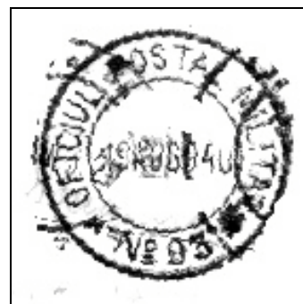
19.8.1940: Ștampila OPM 93, a Diviziei 20 Infanterie

Revine în garnizoane la 16.4.1943, rămânând aici până la 7.4.1944, când