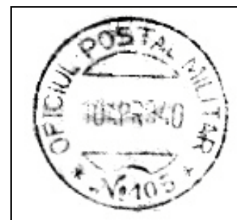
10.4.1940: Ștampila OPM 105, a Diviziei 27 Infanterie

Structură: Reg. 52 Infanterie Reg. 75 Infanterie ?